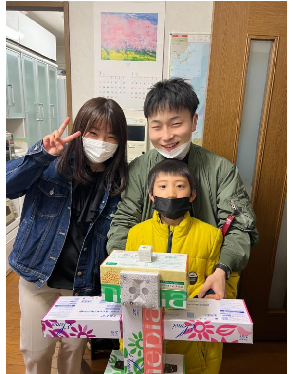
醍矢 今月 8歳6か月