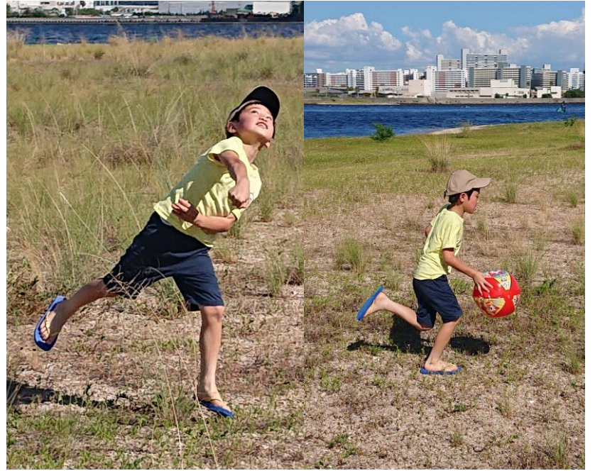
醍矢 今月 7歳 11か月