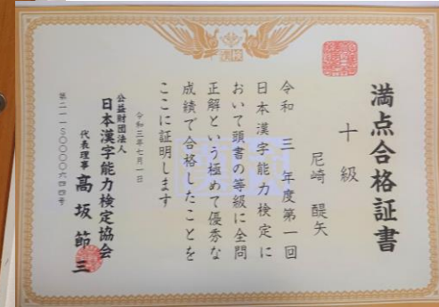
醍矢 今月 7歳 11か月