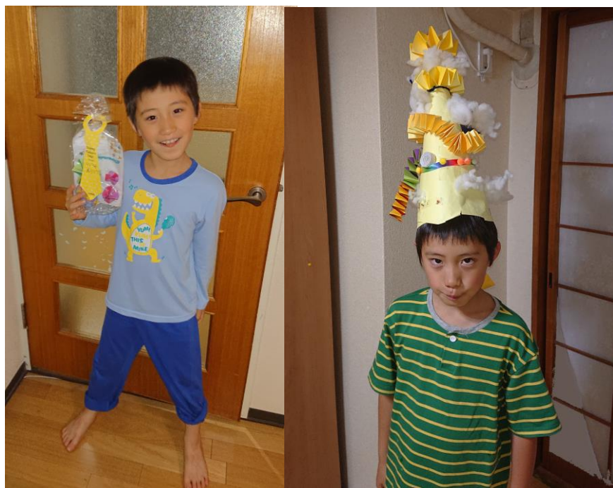
醍矢 今月 7歳 10か月