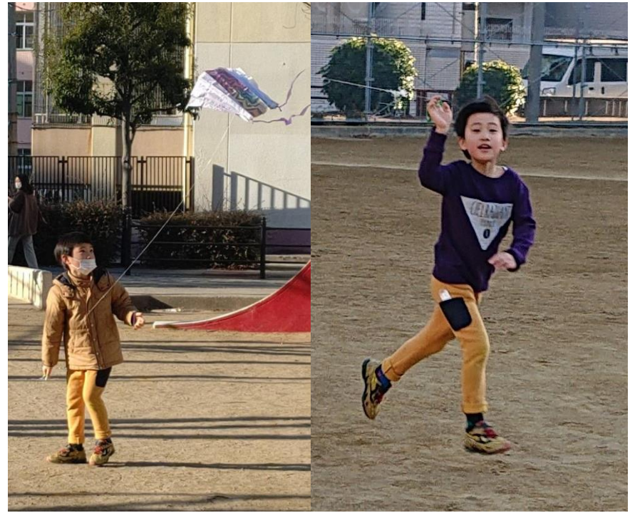
醍矢 今月 7歳5か月